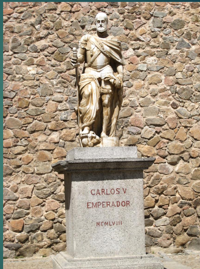
神聖ローマ帝国皇帝カルロス5世（カール1世）の像