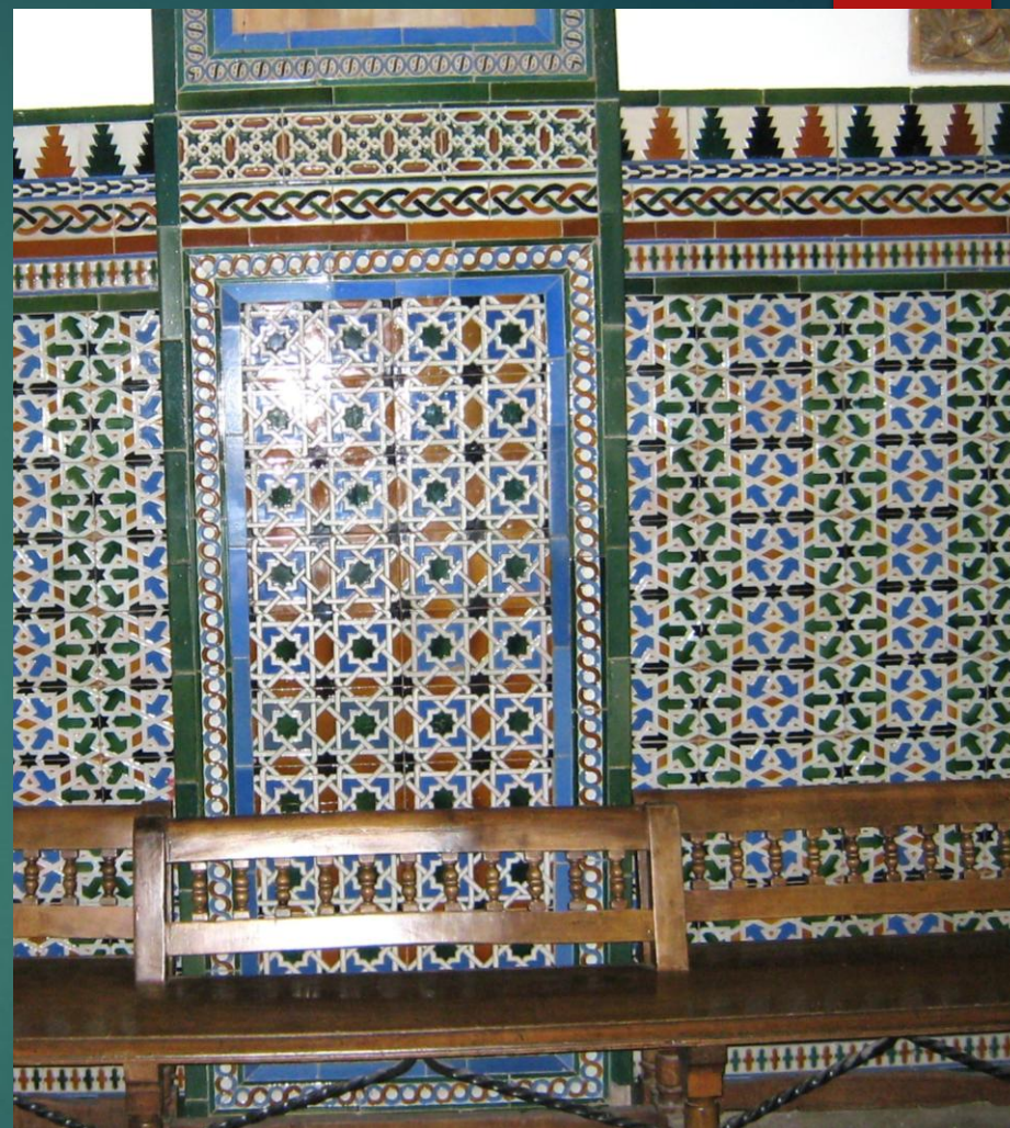
トレド高速鉄道駅構内