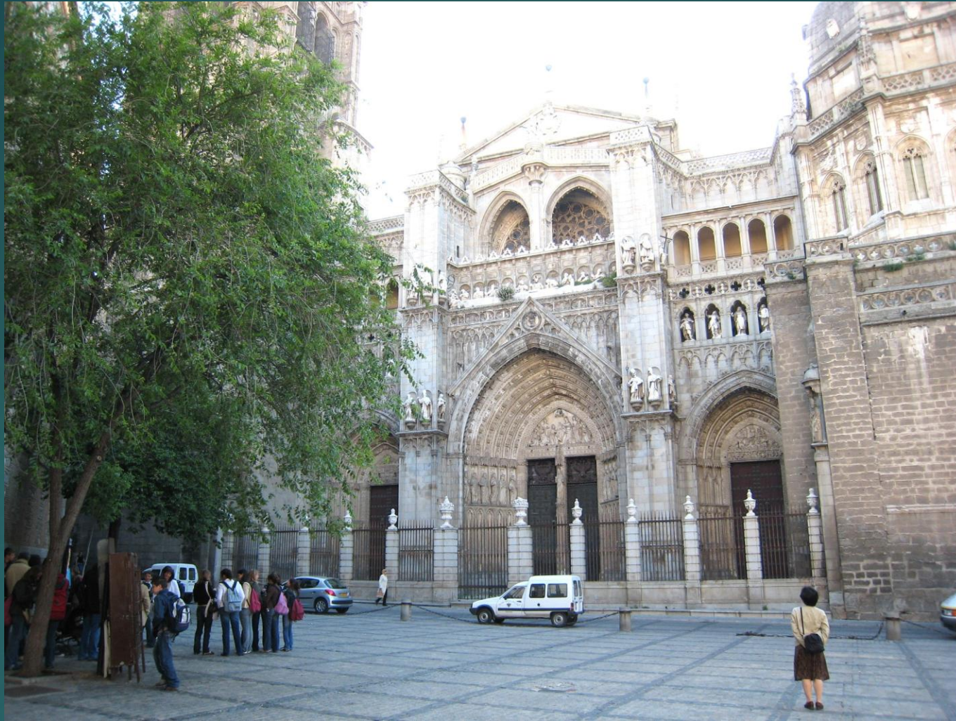
サンタ・マリア・デ・トレド大聖堂の入り口 (Catedral de Santa María de Toledo) またはトレド大聖堂 (Catedral de Toledo)