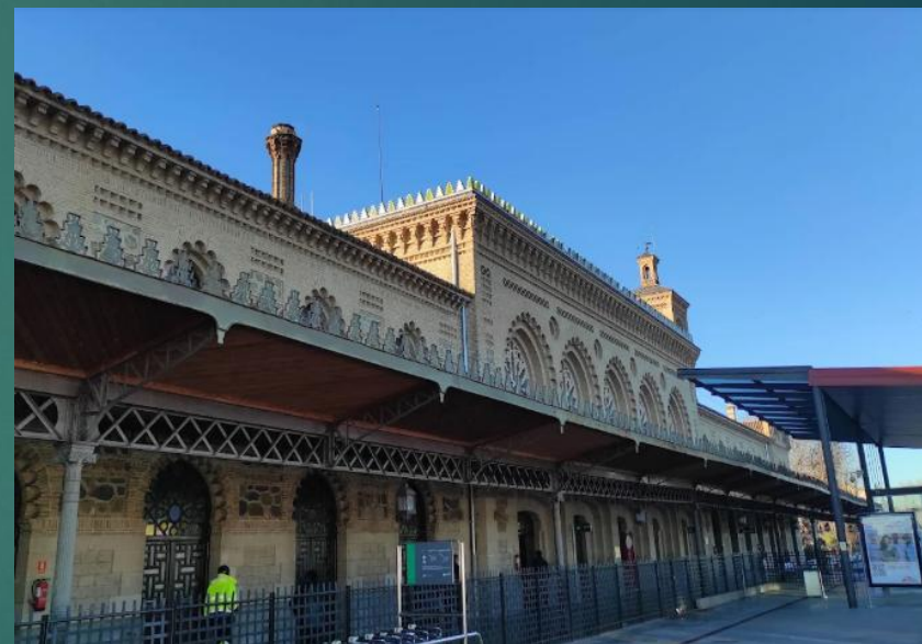
早朝のトレドの高速鉄道(AVE)駅