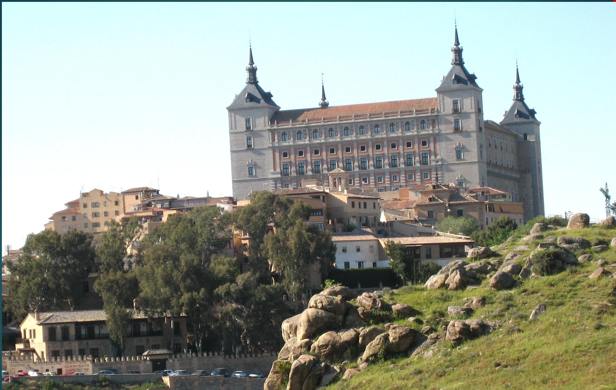
アルカサル（内部は修理中でした）