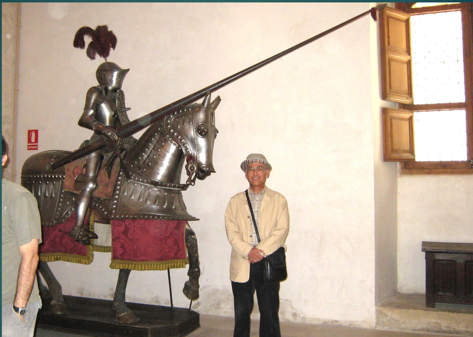
アルカサル 武器の間