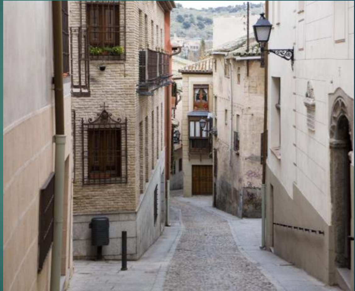
細い路地が入り組んでいるトレドの旧市街