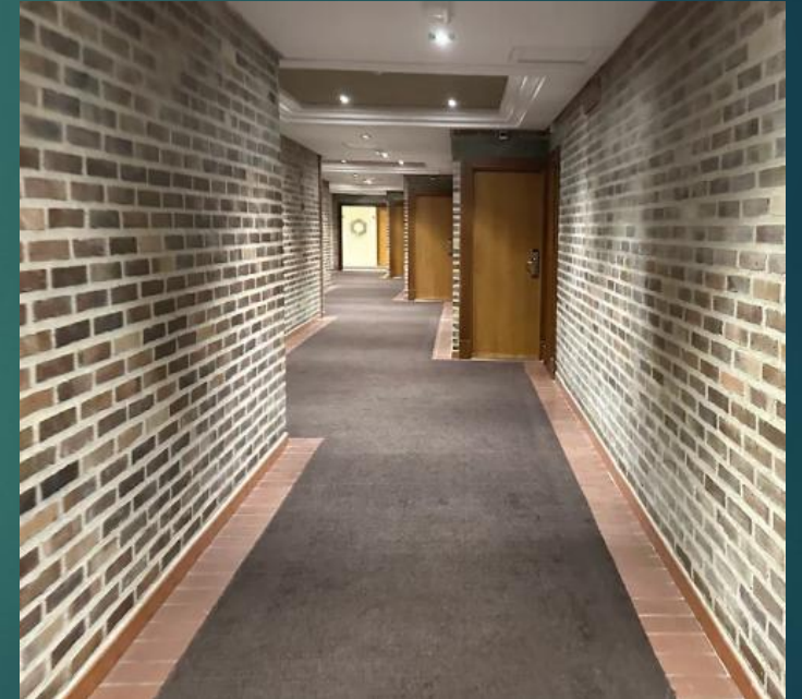
セゴビアのパラドール