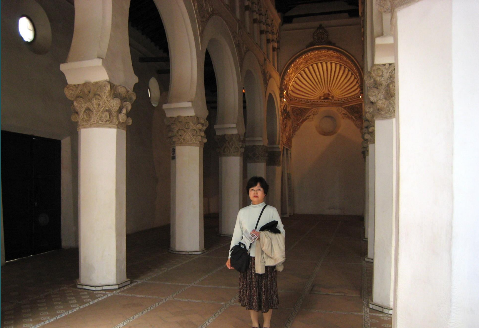
シナゴーク(祭壇等 比較的質素な作り)