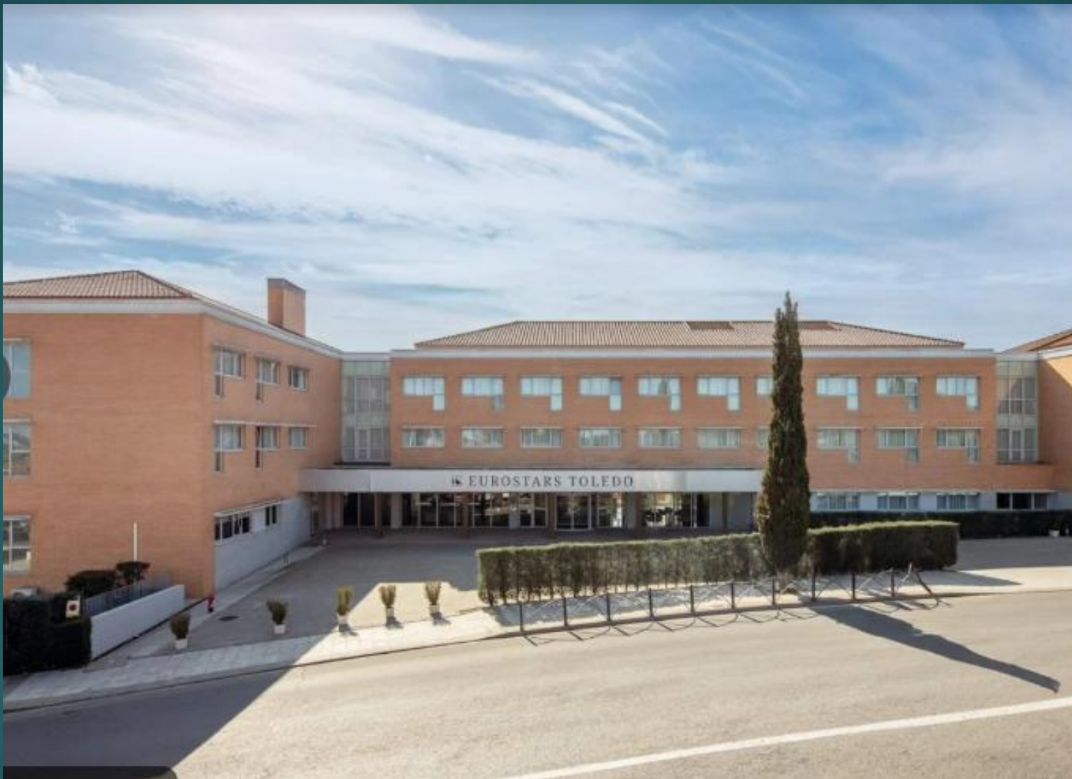
トレドのホテル (ユーロスターズ トレド)