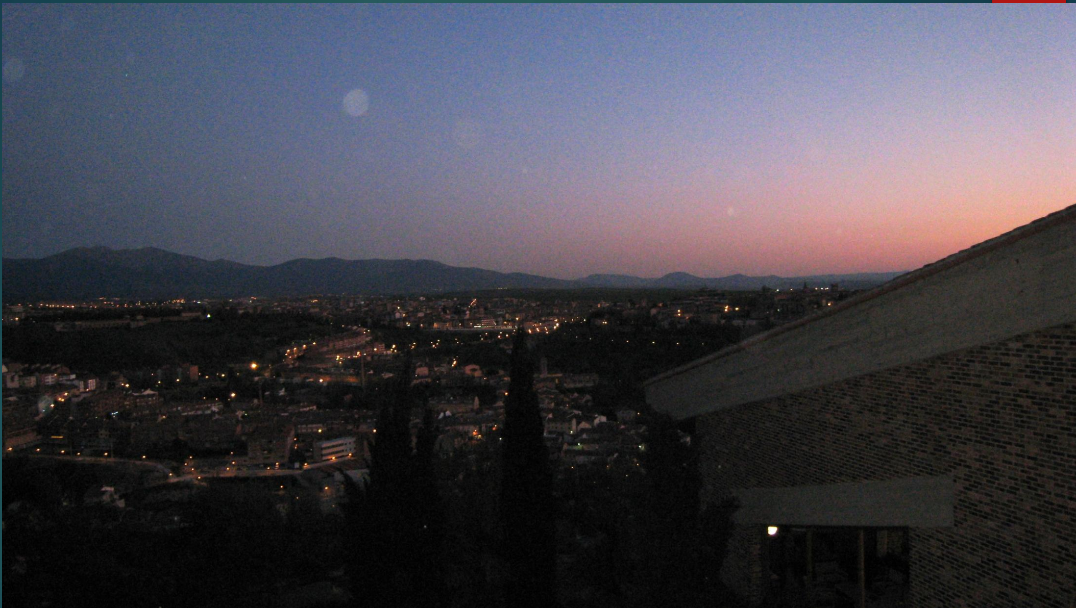
パラドールから見たセゴビアの夜景