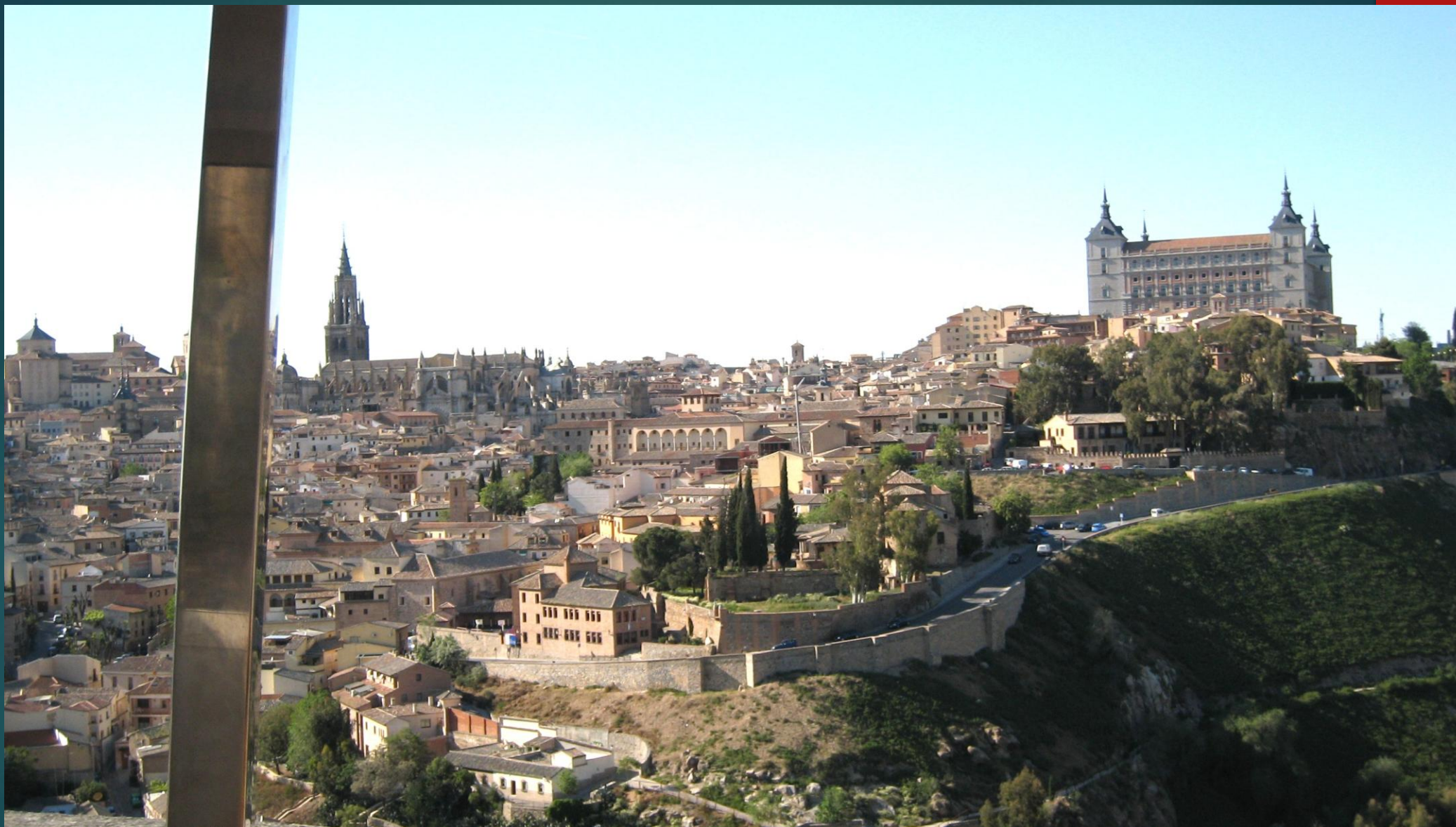
ソコトレインの中から見たトレドの旧市街