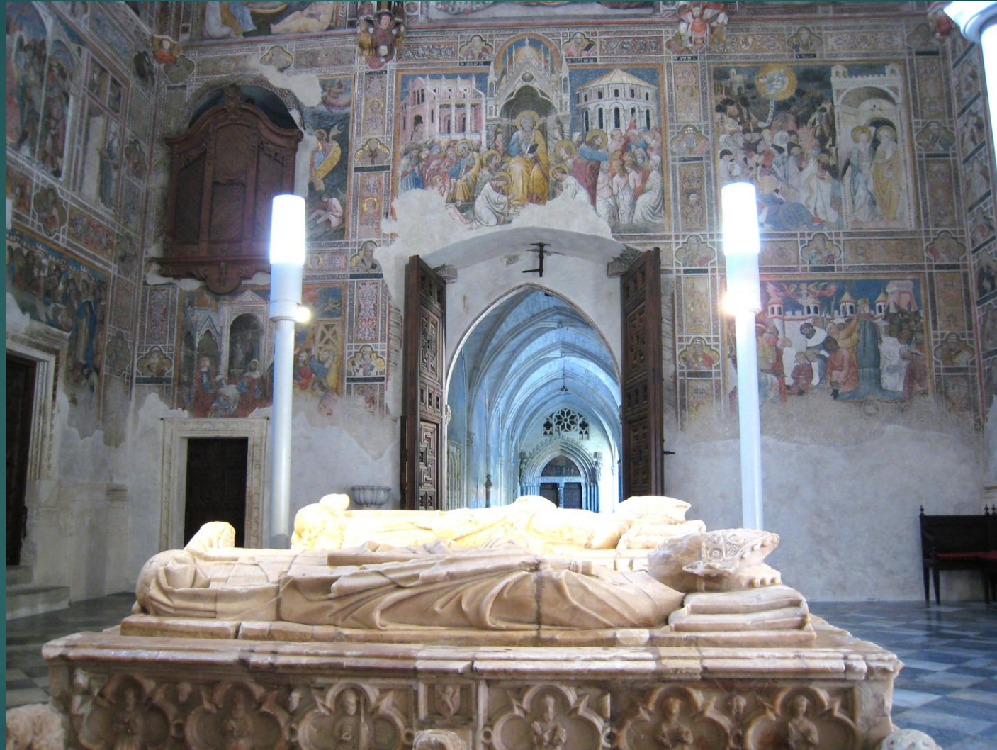
トレド大聖堂の床に安置された墓