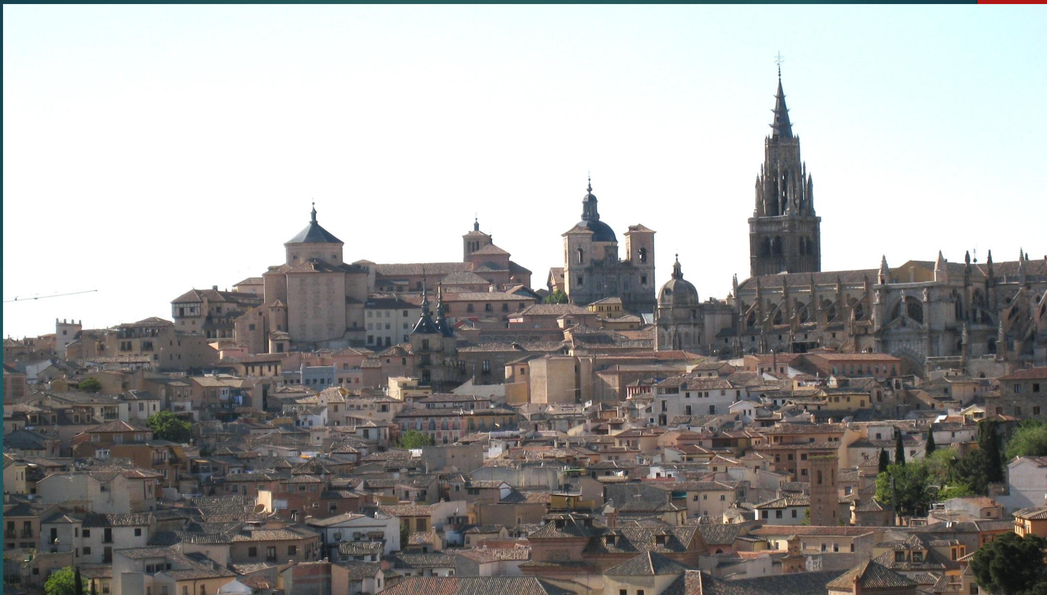
アルカサルからの眺め