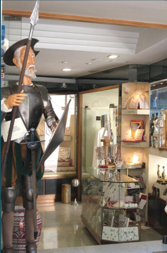
お土産屋さんの入り口 (ドン・キホーテの像あい)