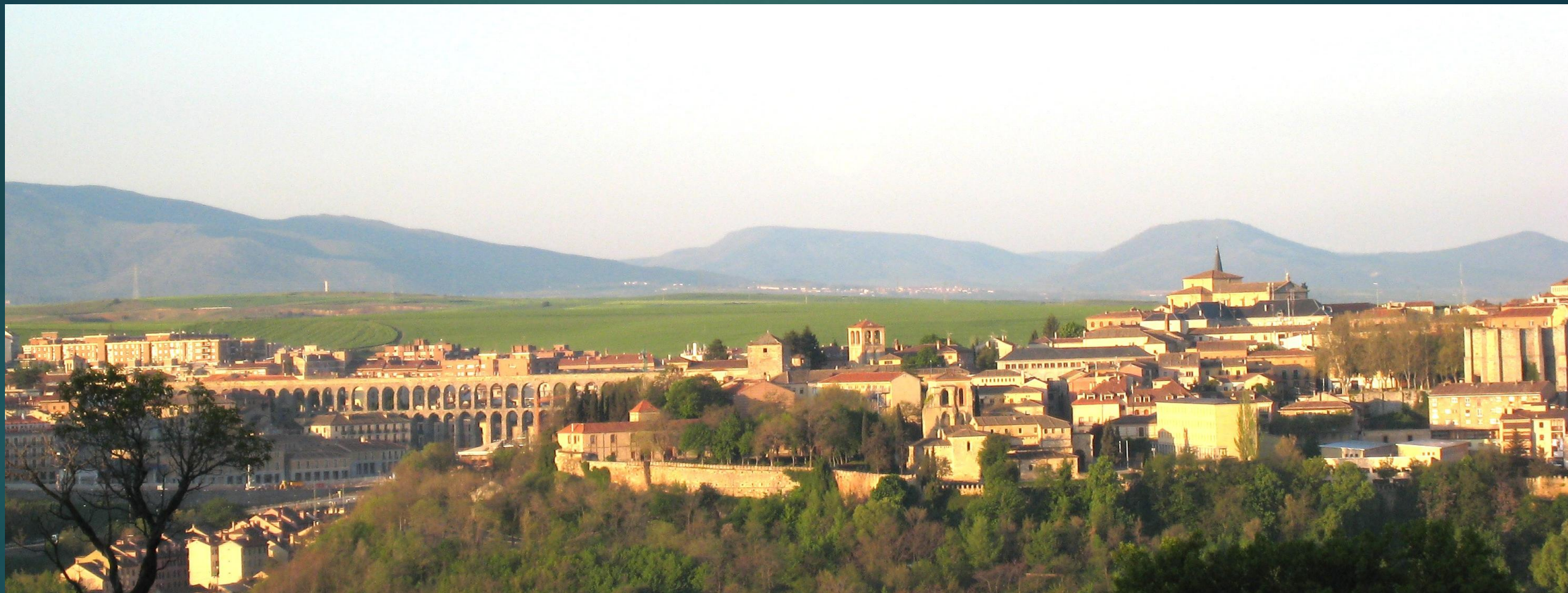
旧市街 左側に古代ローマの水道橋が見える (パラドールからの眺め)