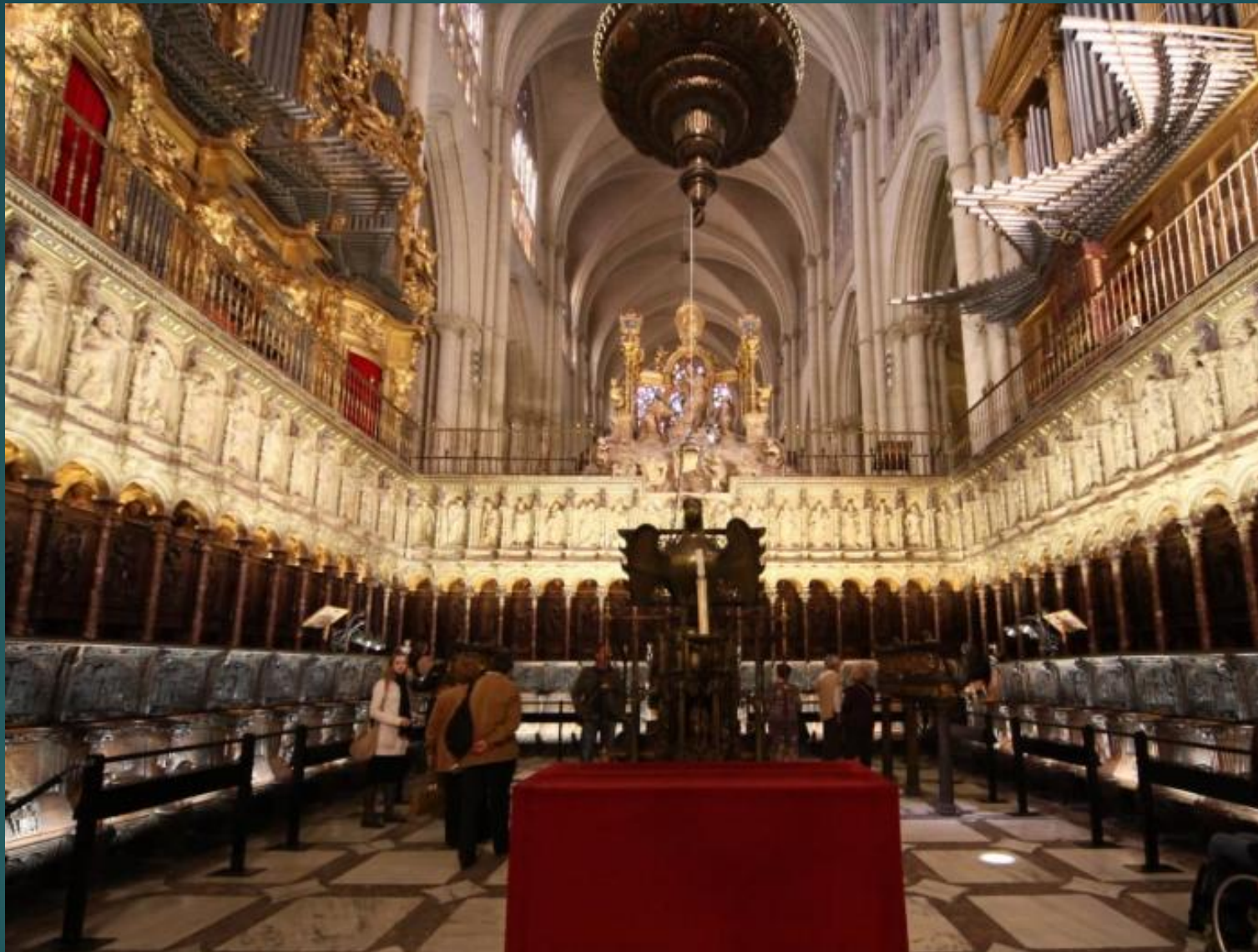
トレド大聖堂の聖歌隊ロフト(聖歌隊に提供される特定の場所)