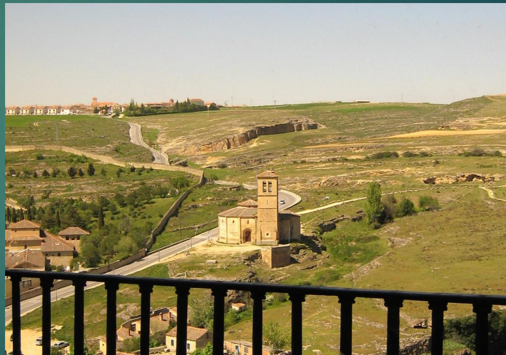
郊外に建つ教会(テンプル騎士団が建てた)