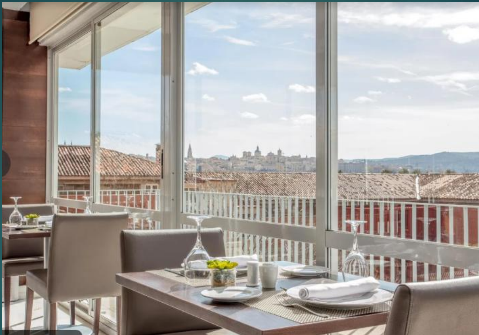
トレドの旧市街が見える