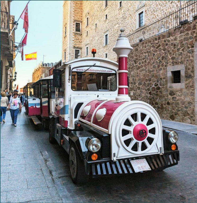
ソコトレインに乗ってトレドの町の外周を一回り