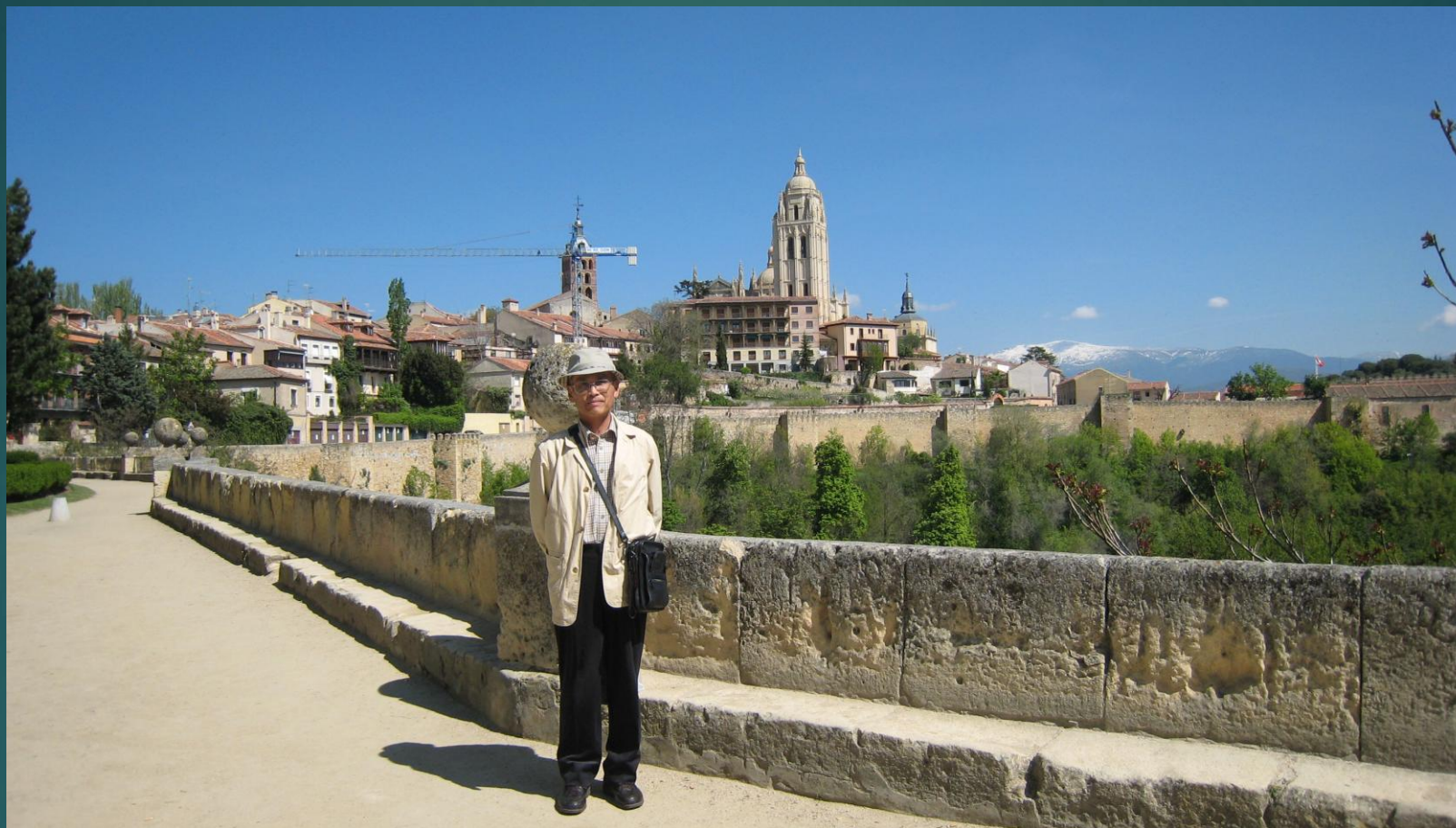
背後はサン・エスティバン教会（塔の女王）