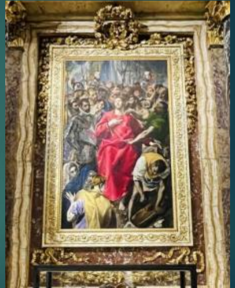
エル・グレコ 「キリストの聖衣剥奪」