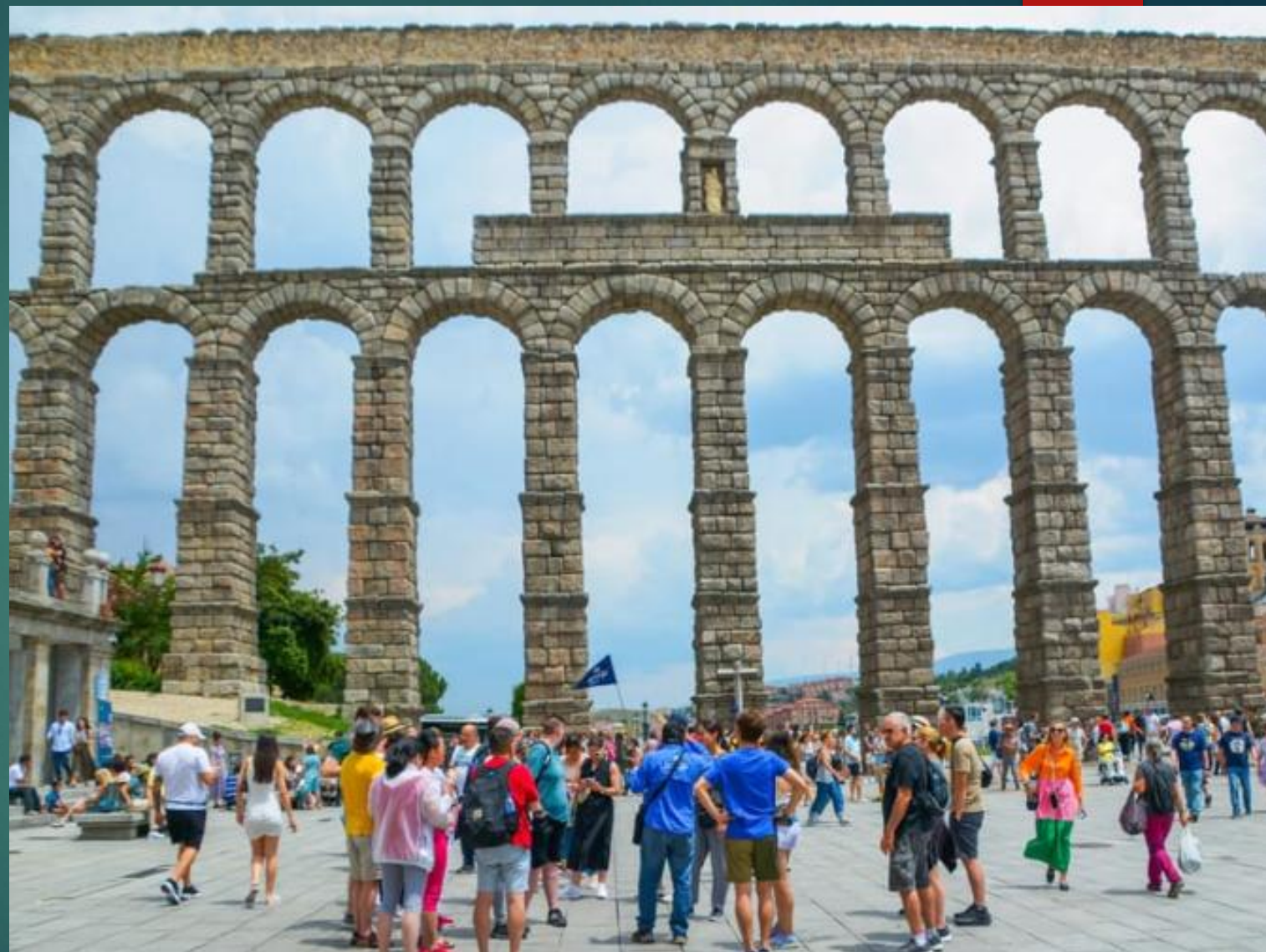
セゴビア 古代ローマの水道橋