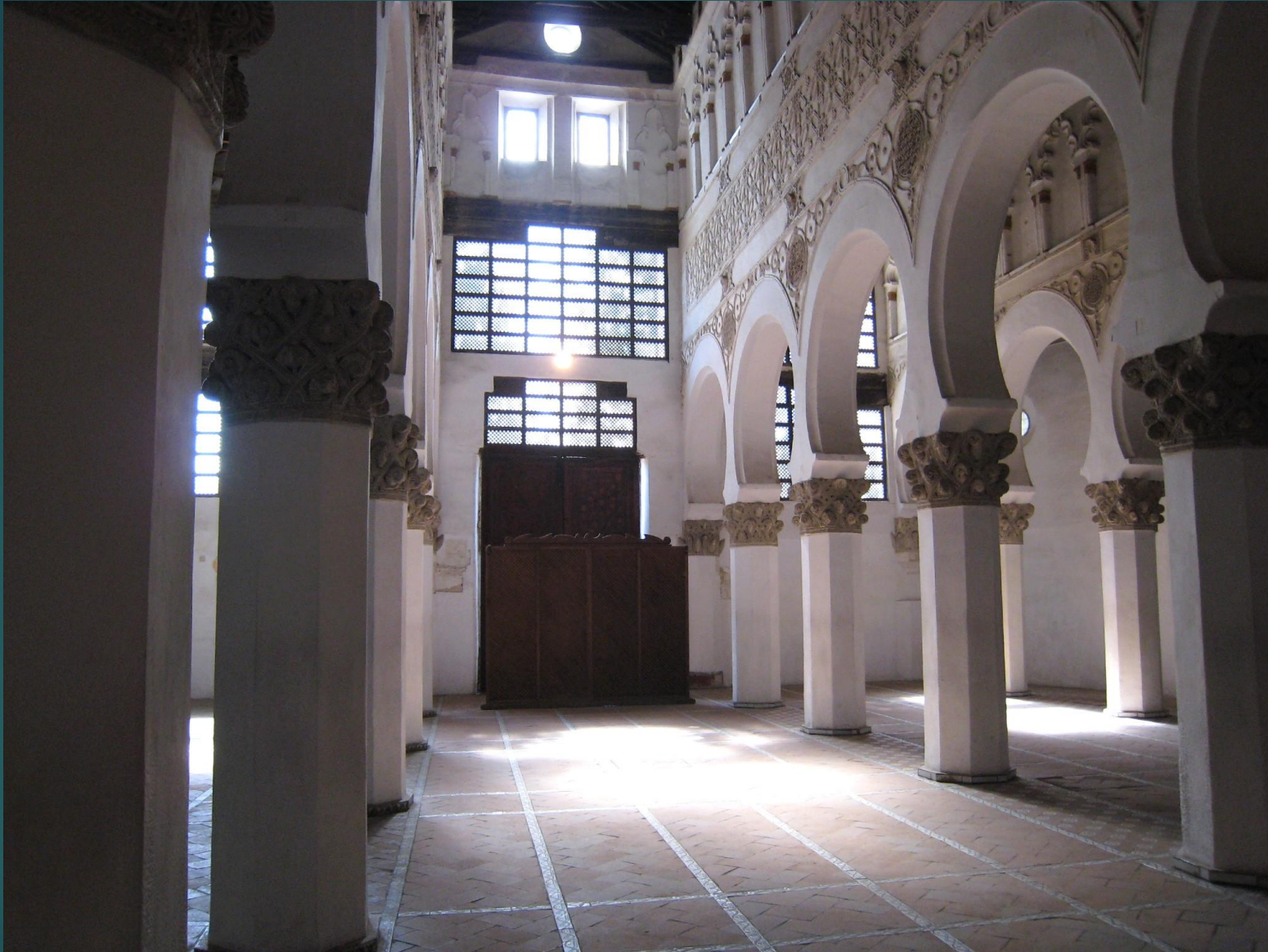
シナゴグ(ユダヤ教の礼拝堂)