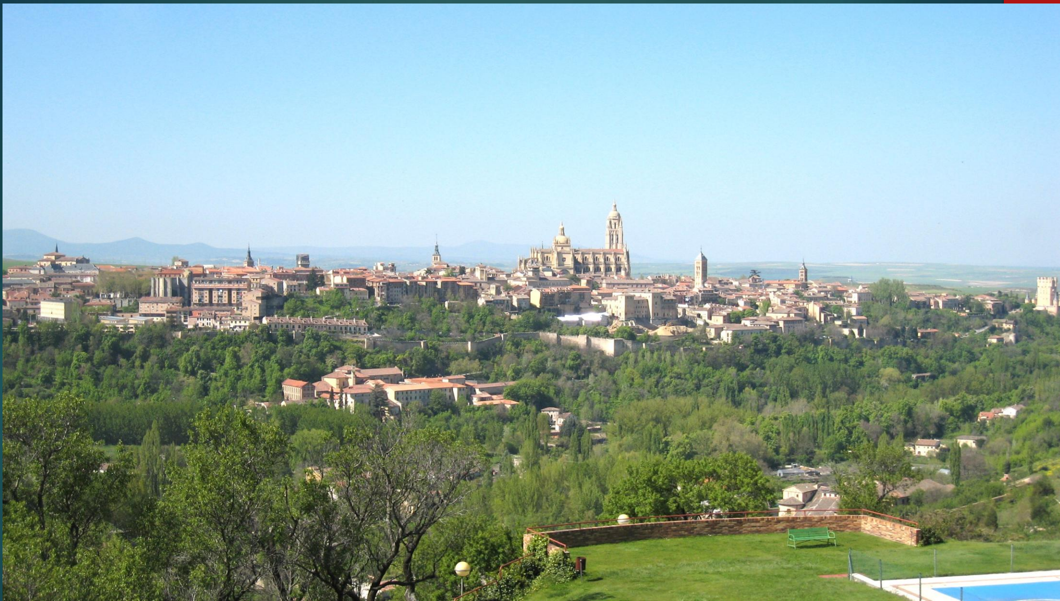
パラドールからの眺め