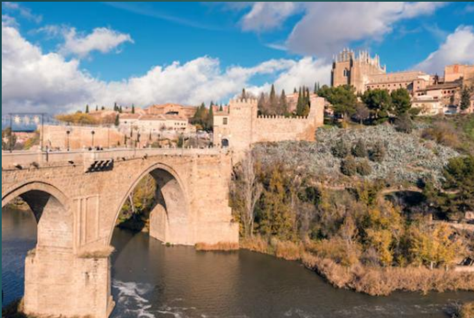
タホ川に架かるサン・マルティン橋